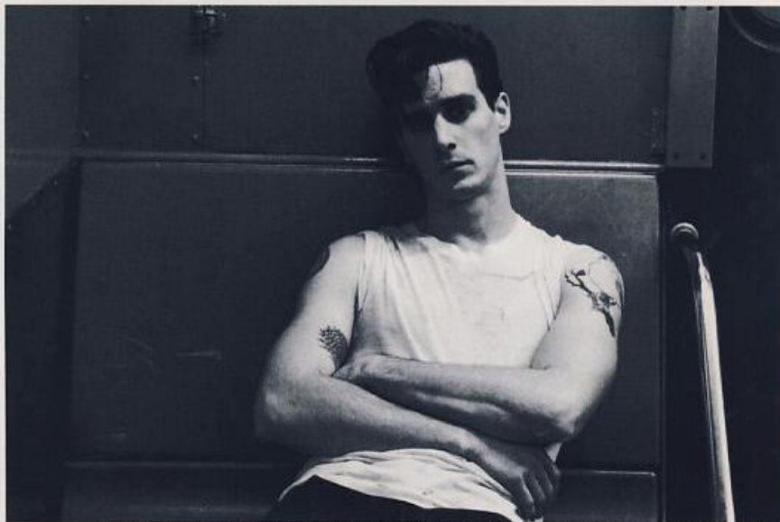
T-SHIRT VINTAGE; JEANS LEVI'S. NELL'ALTRA PAGINA: BLUSA IN SETA CON IMPUNTURE A VISTA E PANTALONI, PAUL SMITH WOMEN; CINTURA IN SETA INTRECCIATA, LANVIN.