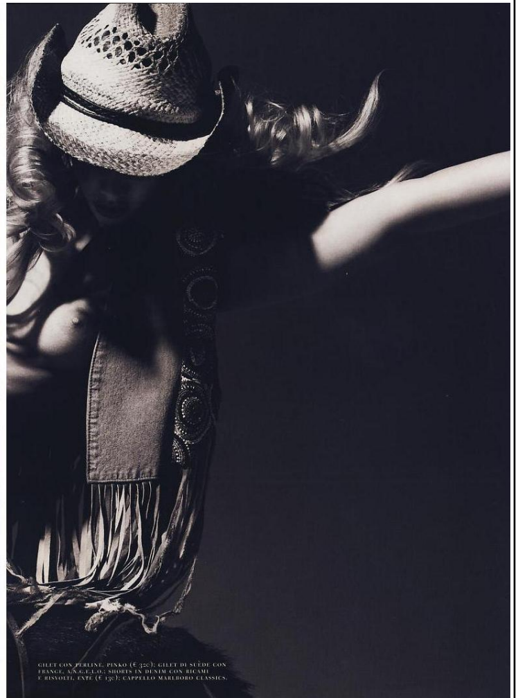
GILET CON PERLINE, PINKO (€ 320); GILET DI SCUIO CON FRANGE, S.C.E.L.O'S SHOPS IN DENIM CON RICAMI E RISOZZI, EXT (€ 130); CAPPELLO MARLBORO CLASSICS.