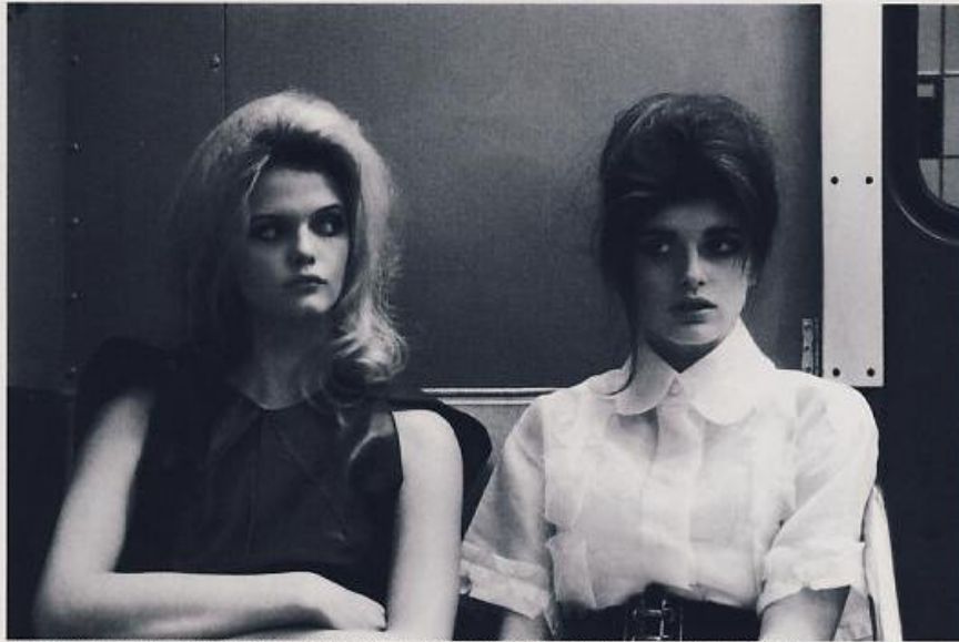
A SINISTRA: TOP IN PELLE, BOTTEGA VENETA. A DESTRA: CAMICIA IN ORGANZA DI SETA E CINTURA IN SUÈDE, FENDI; REGGISENO IN PIZZO, A.N.G.E.L.O.