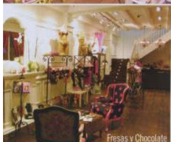
Fresas y Chocolate