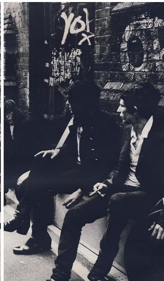
Just Friends (Amy Winehouse)

Remix Sessanta. Calze fluo e stampe optical