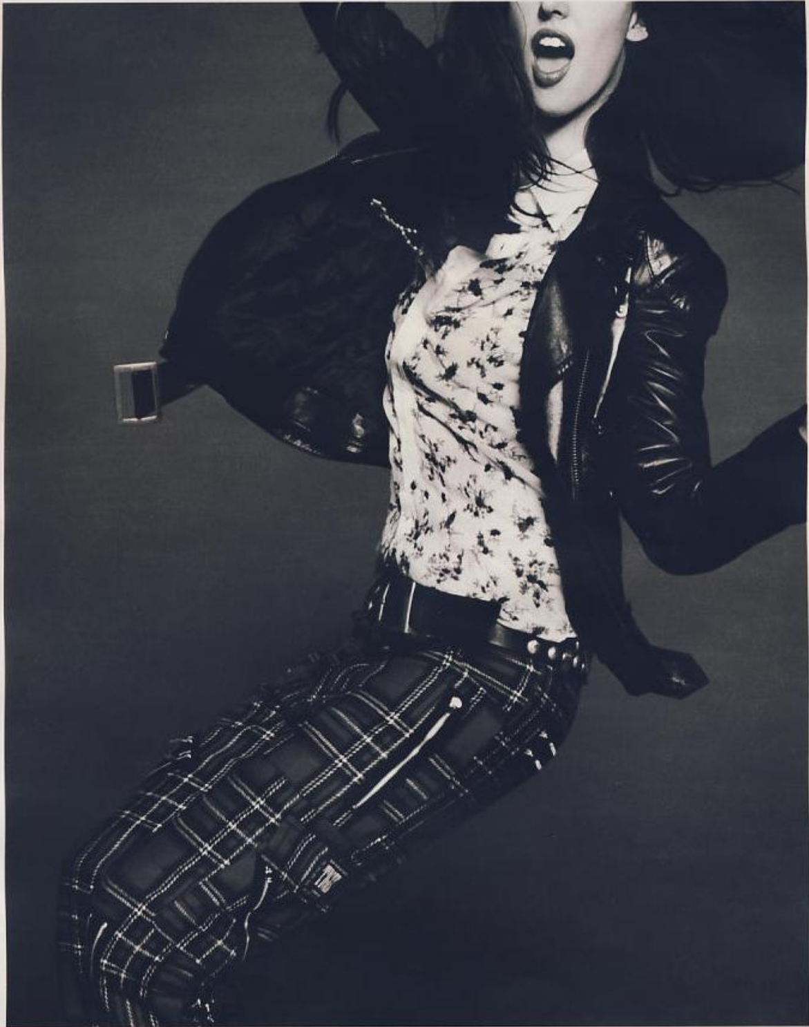
Chiodo di pelle con zip, Marella Sport. Camicia a fiori con profili a contrasto, Coming Soon. Pantaloni tartan, A.N.G.E.L.O. Cintura di pelle con borchie, Firetrap. Pagina accanto, Giacca lunga di lana, Boss Hugo Boss. Top di jersey, Ksubi. Pantaloni di seta, Coming Soon.