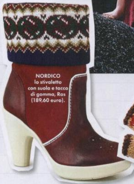
NORDICO la stivaletta con suola e tacco di gomma, Ras (189,50 euro).