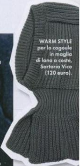
WARM STYLE per la caviglia in maglia di lana scura, Sartoria Vico (120 euro).