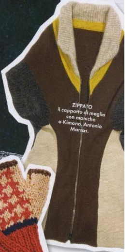
ZIPPATO il cappotto di maglia con maniche a Kimono, Antonio Marras.