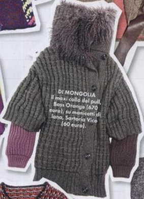
DI MONGOLLIA il maxi collo del pull, Boss Orange (670 euro), su maniconi di lana, Sartoria Vico (60 euro).