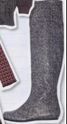
TWEED EFFECT lo stivale, Sigerson Morrison.