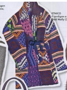
ETNICO il cardigan a vestaglia, Odd Molly (350 euro).