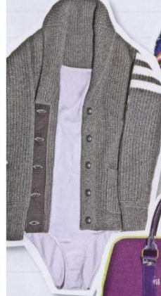
DA COLLEGE il cardigan maschile, Hydrogen (300 euro), su body di cotone, Deba (24 euro).