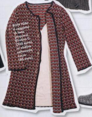
BON YON il cappotto di lana ricicciata, Kristina La (205 euro), su abito in saltovestito, Jucca (188 euro).