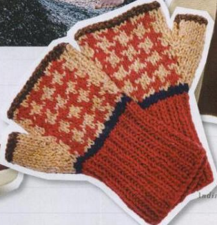
TRICOT i mezzi guanti di lana, Paul Smith Women Accessories (140 euro).