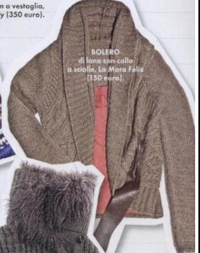
BOIERO di lana con collo a scollina, La Mara Faliz (150 euro).