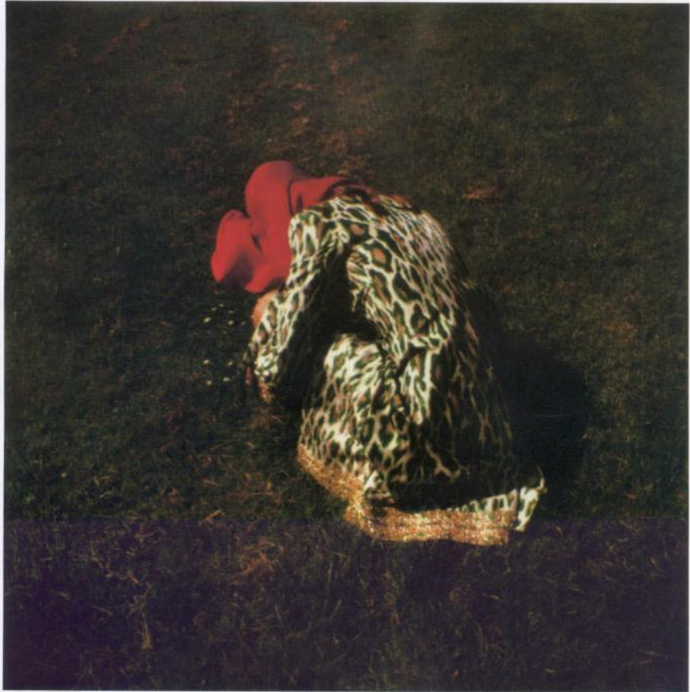
CAPPOTTO D'OPHOPELLO IN SETA CON BORDI-GIOIELLO DI SWAROVSKI E COLLO-SCIARPA. DIOR BY JOHN GALLIANO CRUISE.