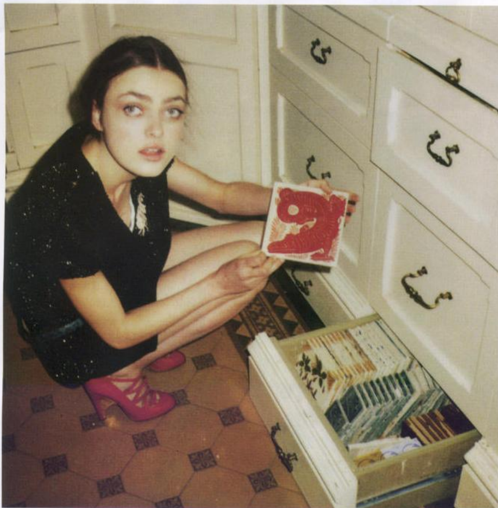
MINIABITO IN MICROTULLE STRETCH RIVESTITO DI PAILLETES CON BORDO DI LANA A COSTE, LOVE SEX MONEY, REGGISENO MALIZIA BY LA PERLA, SPILLA VINTAGE, A.N.G.E.L.O., CINTURA IN PELLE STAMPA COCCO, ROBERTO CAVALLI, DECOLLETTES IN VERNICE CON INCROCIO DI LISTINI, CHANEL