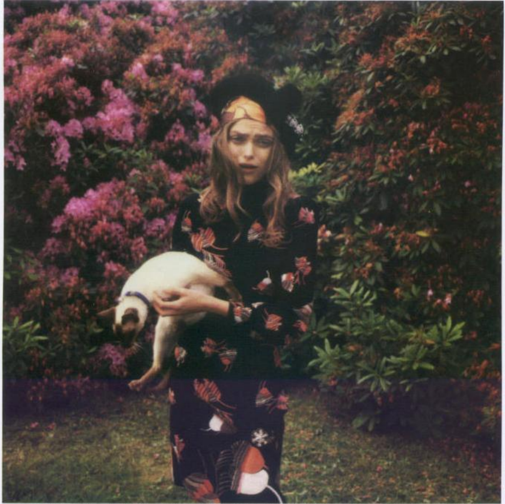
ABITO IN LANA, CON RICAMI FLOREALI. GUCCI. CAPPELLO IN PANNINO DI LANA. A.N.G.E.L.O. FOULARD IN SETA STAMPATA. KRIZIA.